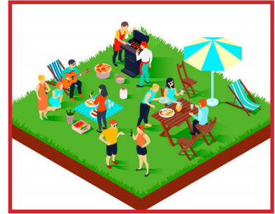
Met vrienden barbecueën