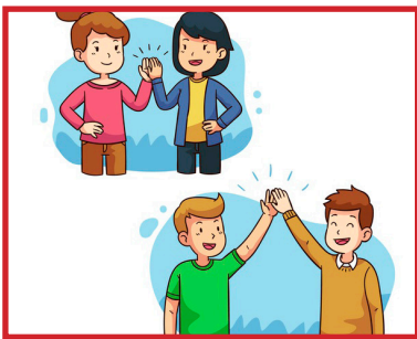
Vermijd lichamelijk contact