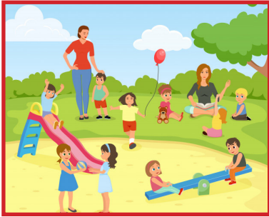
Spelen in de speeltuin