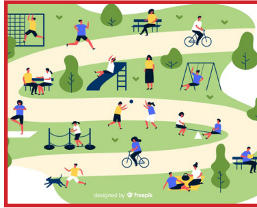
Samen in het park