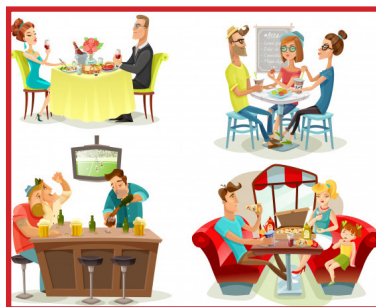
Op restaurant/café gaan